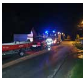
3.10.22-Jurków poszukiwania zaginionej osoby