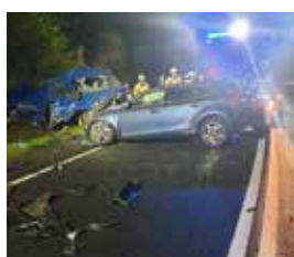
2.10.22-Witowice Dolne wypadek