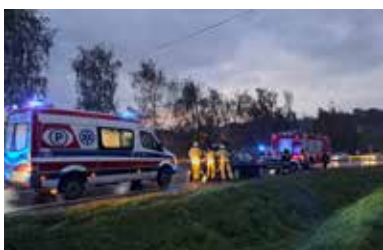
14.10.22-Czchów droga K-75 - wypadek