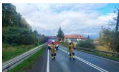
3.10.22-Czchów-Jurków neutralizacja substancji ropopochodnych