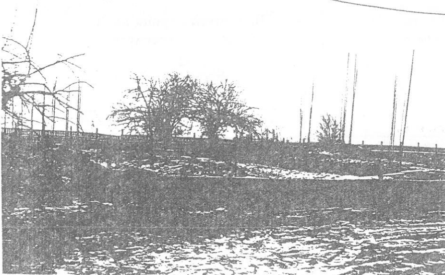
Teren budowy szkoły w Domosławicach - lato 1991 r.