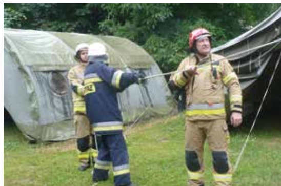
5.07.22-Piaski Drużków drzewo zagrażające obozowisku harcerzy