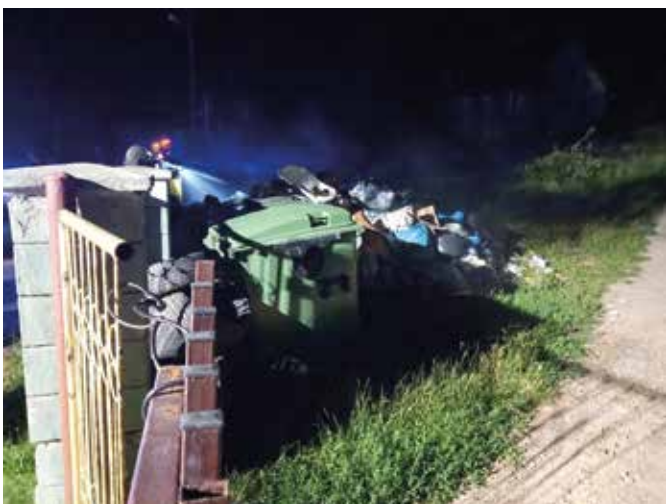
10.07.22-Czchów pożar śmieci