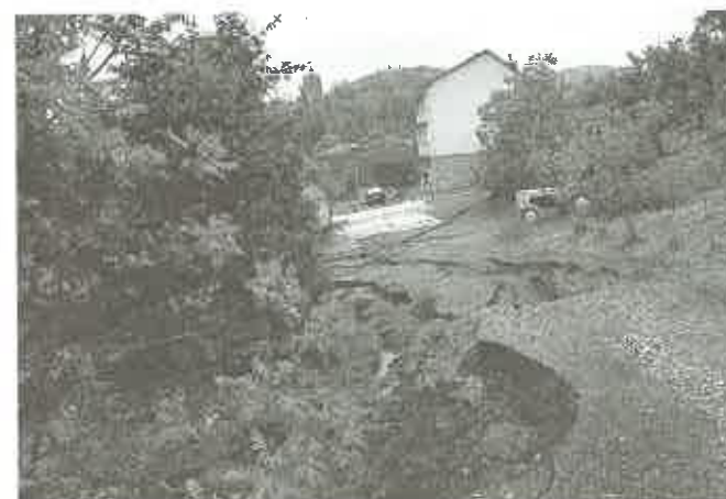
Zniszczona doszczętnie ulica Podgrodzie - Czchów