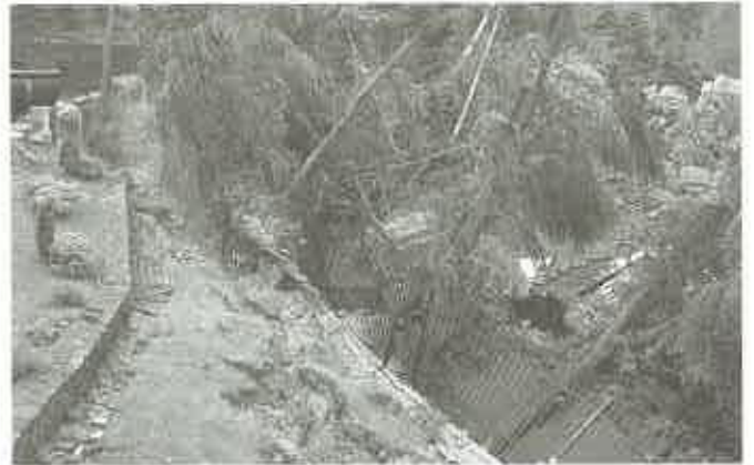
Po wzmożonych opadach ulewnej deszczu uaktywniły się osuwiska ziemi