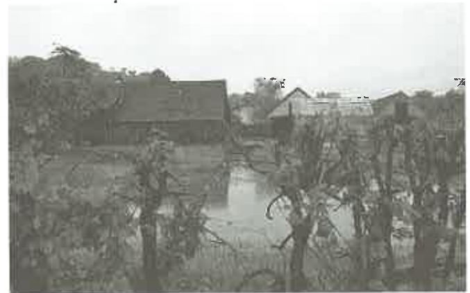
Woda w gospodarstwach domowych, piwnicach...