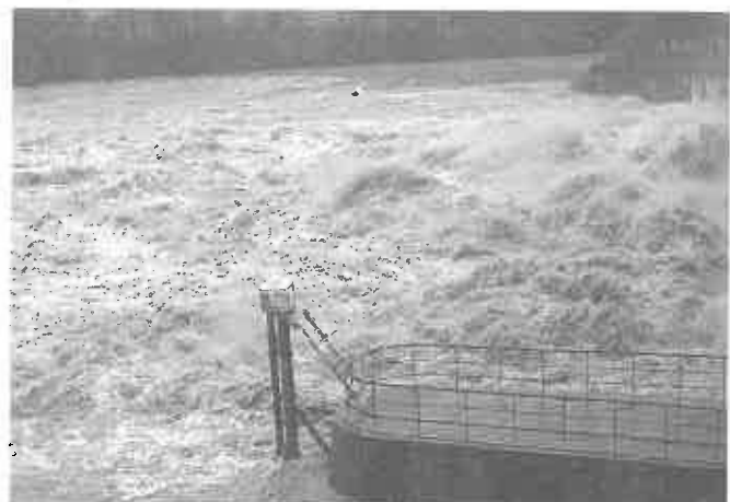
Kulminacyjna fala powodziowa, przepływ wody 2200 m 3 /sek. - 17 maja.