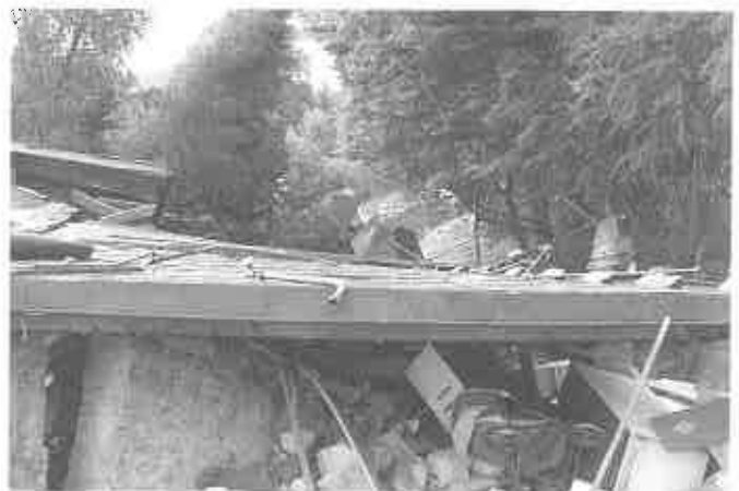
W najgorszej sytuacji - Piaski-Drużków - kilkadziesiąt domów zniszczonych, obsunięte drogi, potrywane sieci wodociągowe