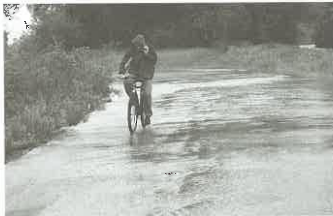
Zalana droga do żwirowni w Jurkowie