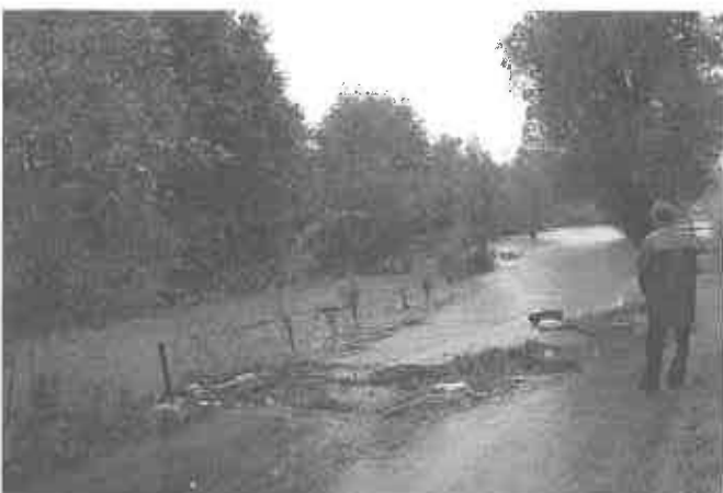
4 czerwca nadeszła II fala powodziowa, znów Piaski Drużków stanęły w wodzie