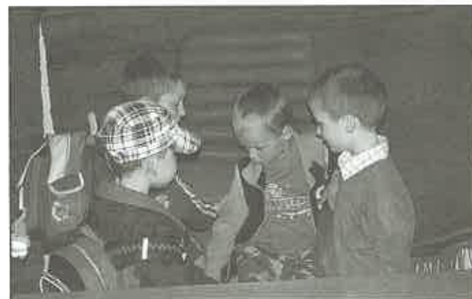
Walka o fotel Burmistrza