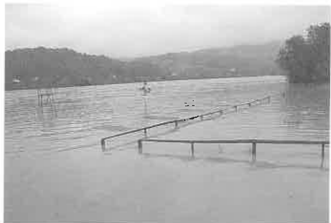
Zalany kompleks sportowy na stadionie w Czchowie, widoczne tylko konstrukcje bramek i ogrodzenia. 17 maja.