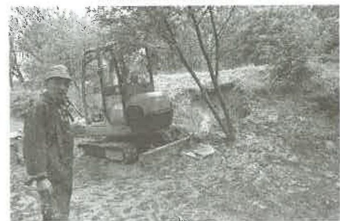
Osuwiska powodują przerywanie rur wodociągowych - ciągła interwencja pracowników ZUK - na zdj. Tworkowa