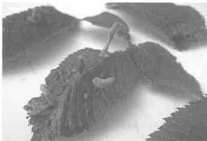
Kogutnica wiązowa (bawełnica wiązowo – turzycowa).