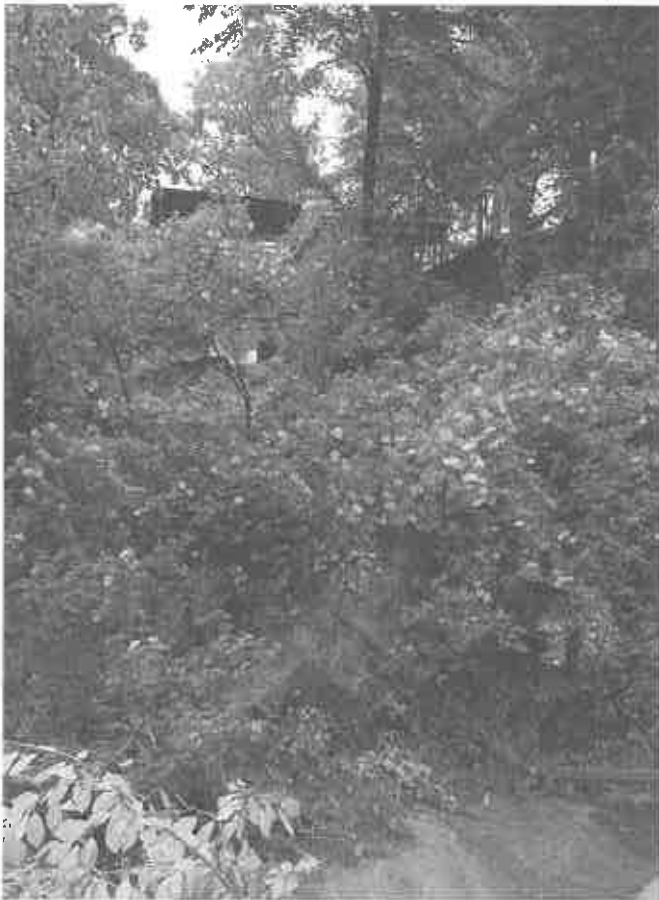
Czchów powyżej Łazisk - obsunięta droga