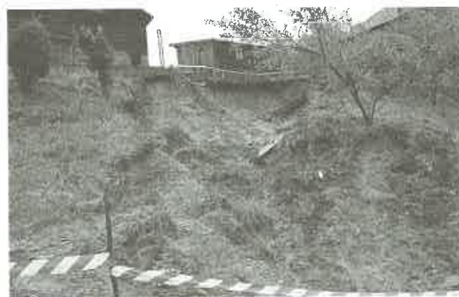
Jedno - osuwisk, Będzieszyna - 17 maja