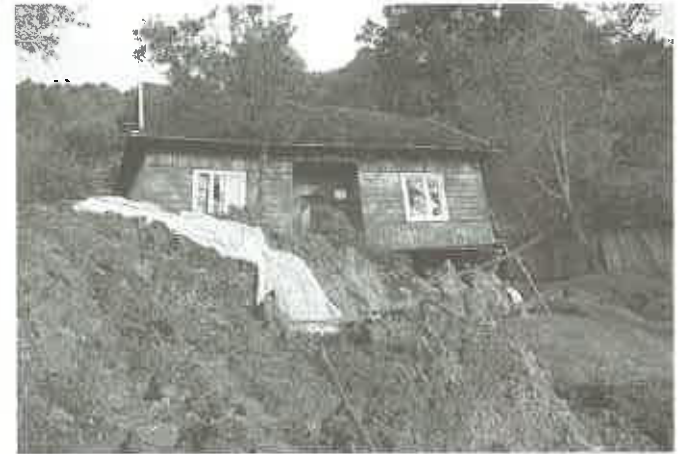
zapadały się drogi, otoczenia domów, osuwały całe pola z uprawami - ost. zdj. z Wytrzyszczki