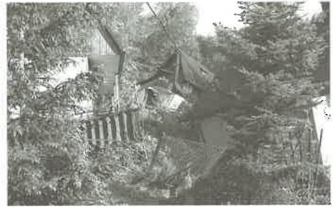
Tragedia dotknęła też domy mieszkalne, ewakuowano ludzi i ich mienie...