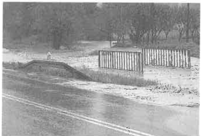
Pogranicze Tworkowej i Tymowej, rzeka Zelina uniemożliwia przejazd - 16 maja