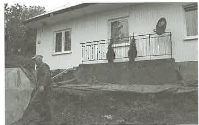
Osunięcie ziemi przed domem pp. Tłuczków - Czchów