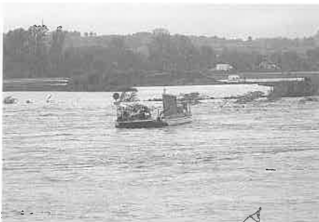
Zerwany prom do Piasków Drużkowa znosi w kierunku Filipowic - 17 maja.