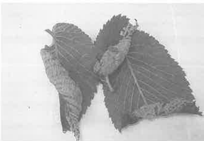
Bawełnica wiązowo - porzeczkowa