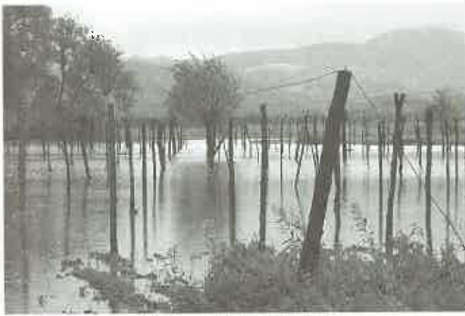
Zniszczone naddunajcekie uprawy