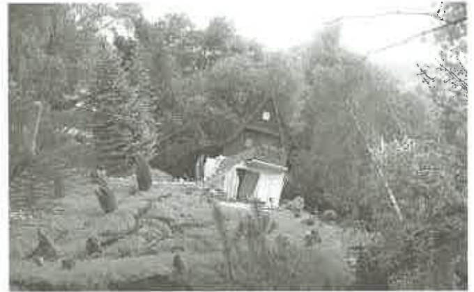
...miejscowość Piaski Druczków ucierpiała najbardziej. Zniszczonych zostało wiele domków campingowych