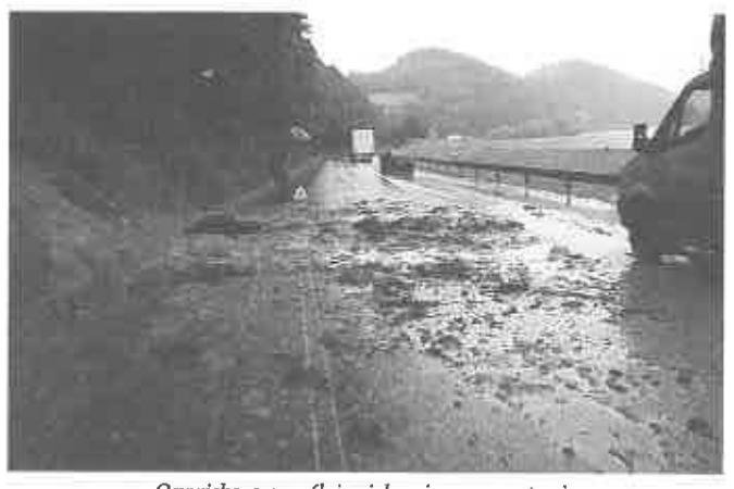
Osuwiska, szczególnie niebezpieczne przy trasie K-75 w kier. Nowego Sącza, nadal są aktywne