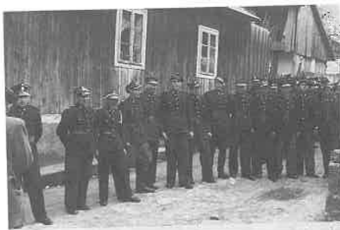
Rok 1949 - Jurków

12 budynków na tzw. zachodniej górze. Do walki z żywiołem zjechały OSP z okolicznych miejscowości, jednak ich działania i trud nie przyniosły większego rezultatu z powodu braku wody. Pożar ugasiła dopiero przybyła z Okocimia Zakładowa Straż Pożarna, która dysponowała motopompą i wężami tłocznymi. Ta tragedia uświadomiła mieszkańcom Jurkowa, że należy zapewnić wodę dla wsi i do celów przeciwpożarowych.