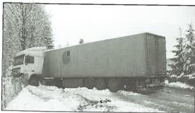
29 listopada 2010 r. - Biskupice Melsztyńskie - poślizg, na wskutek ciężkich warunków drogowych, samochodu ciężarowego.