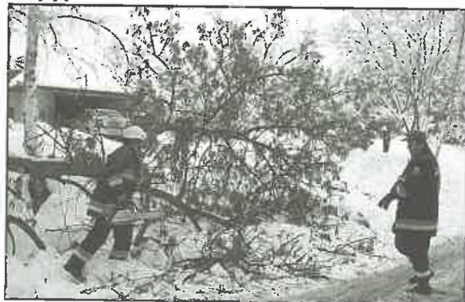
29 listopada 2010 r. - Złota - usuwanie złamanych przez śnieg drzew i konarów