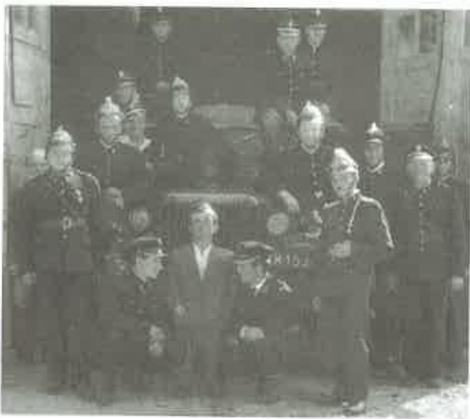
Na tle Jurkowskiej remizy strażacy i amerykański Dodge sprowadzony z wieliczki w 1958