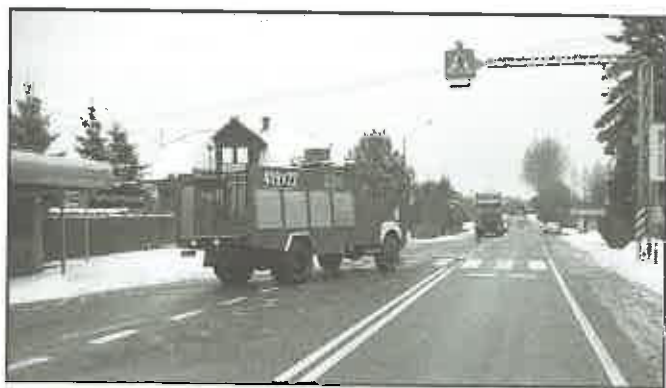
10 grudnia 2010 r. - Czchów - droga K-75 neutralizacja substancji ropopochodnych.