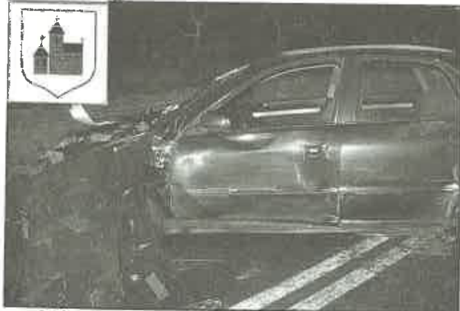
27 listopada 2010 r. - Biskupice Melsztyńskie - pijany kierowca nie opanował pojazdu i na łuku drogi zjechał do przydrożnego rowu, doszczętnie rozbijając samochód.