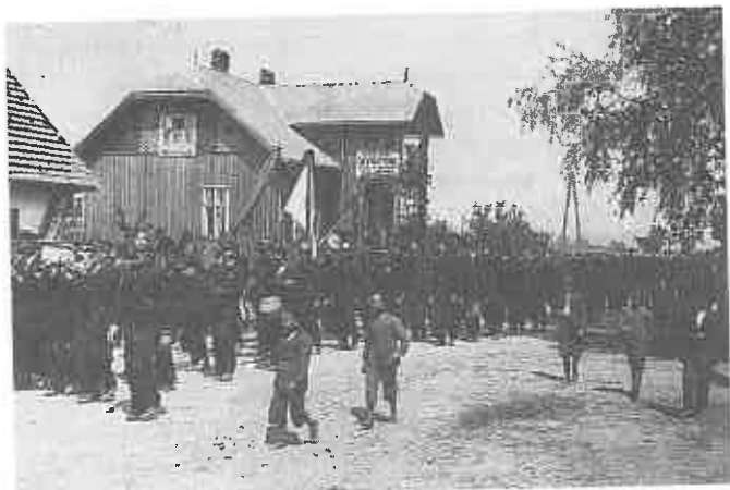
1925 - centrum Jurkowa

Podczas wojny, a szczególnie działań frontowych znaczna część majątku straży uległa zniszczeniu, głównie na skutek