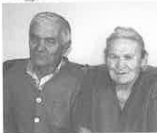
PP. Kędrowie z Tworkowej przeżyli wspólnie już ponad 50 lat

NA PACHÓWCE W ŻMIĄCEJ W LATACH 1943-1953 – ZE WSPOMIENIŃ GENOWEFY KĘDER Z TWORKOWEJ