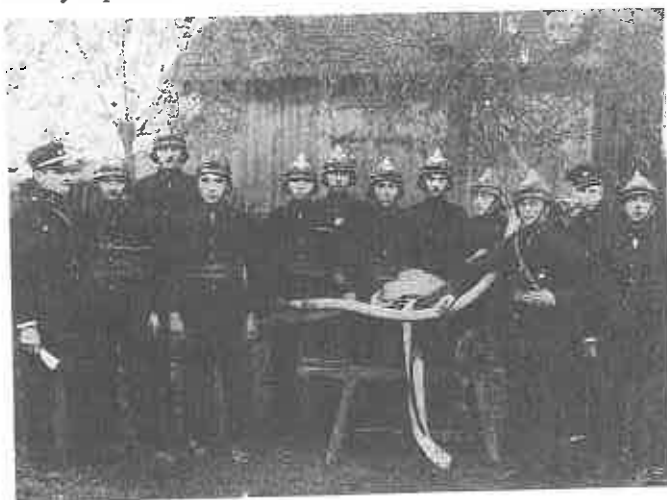
1925 Poświęcenie Pompy

Dzięki naciskowi Zarządu OSP na władze powiatowe wywalczone jedynie budowę jednego boks na sprzęt przeciwpożarowy przy budującej się bazie kółka rolniczego. W tych bardzo trudnych czasach strażacy byli szczególnie za-