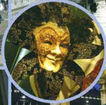
fot. J. Dębiec