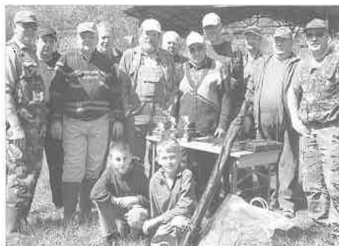
Sezon Wędkarski 2009 rozpoczęty, informacje w kolejnym numerze.