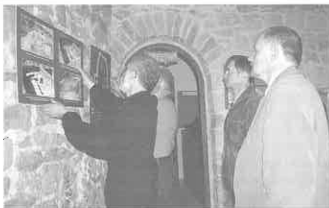
Muzeum okręgowe w Tarnowie udostępniło wystawę archeologiczną na zamku w Czchowie

Informacje dodatkowe: MOKSiR w Czchowie; Rynek 12; Tel.: (014) 6635230; 6843188; www.czchow.pl