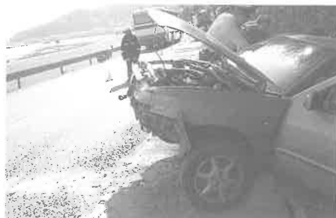
20 kwietnia br. – Wytrzyszczka, droga K-75, wypadek