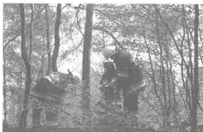
7 kwietnia br. Piaski-Drużków, Tropie – pożar lasu od zapalenia dzikiego wysypiska śmieci! Warto zaznaczyć, że zabudowania mieszkalne znajdowały się w sąsiedztwie lasu