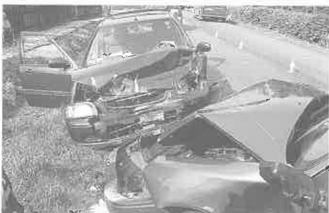
18 maja br. - Biskupice Melsztyńskie - pijany kierowca samochodu osobowego doprowadził do czołowego zderzenia z innym pojazdem. Trzy osoby ranne.