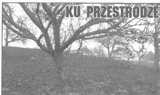
8 marca 2012 r. - Czchów, pogorzelisko po gaszeniu traw, w pobliżu domostw i lasu.