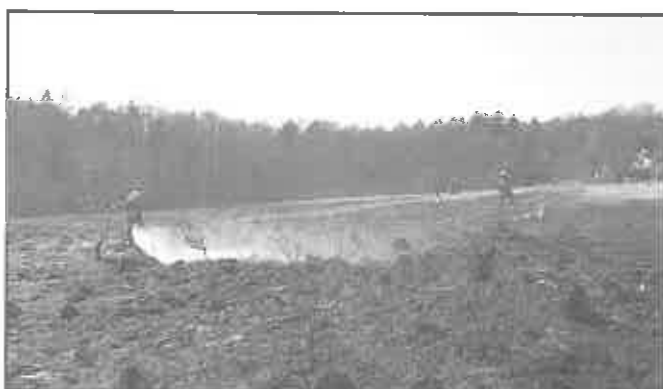
17 marca 2012 r. Czchów - Podkacie, gaszenie płonących traw