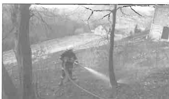
21.03.2012 r. - Piaski Drużków - pożar trawy i lasu