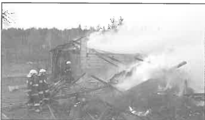
11 marca 2012 r. - Piaski Drużków - pożar stodoły