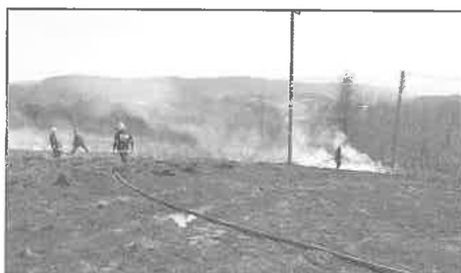
16 marca 2012 r. Czchów – gaszenie płonących traw