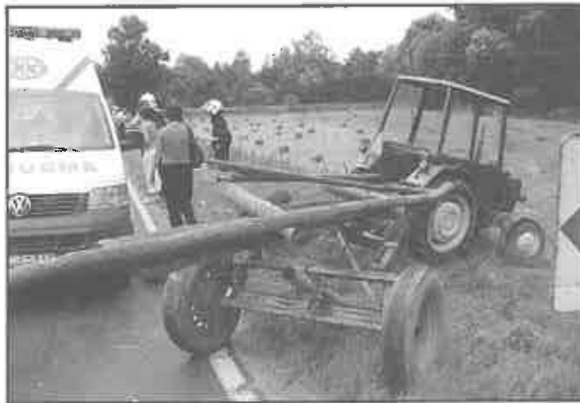
03. sierpnia 2010 r. – Tymowa – wypadek drogowy