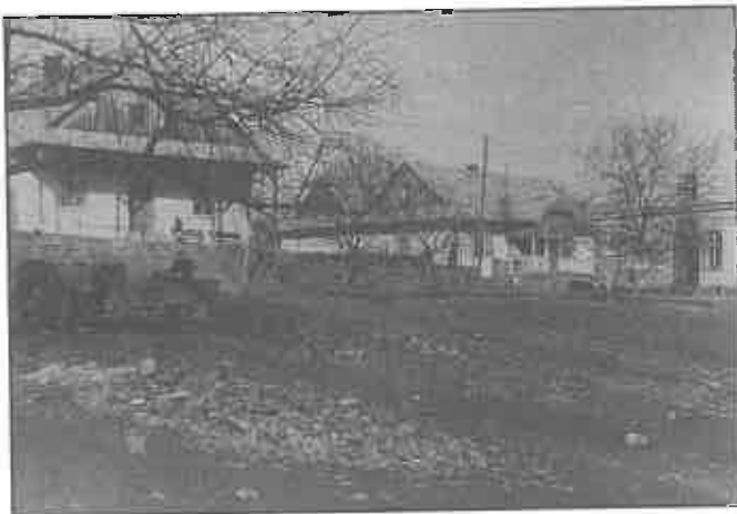
Widok czchowski rynek – domy z podcieniami