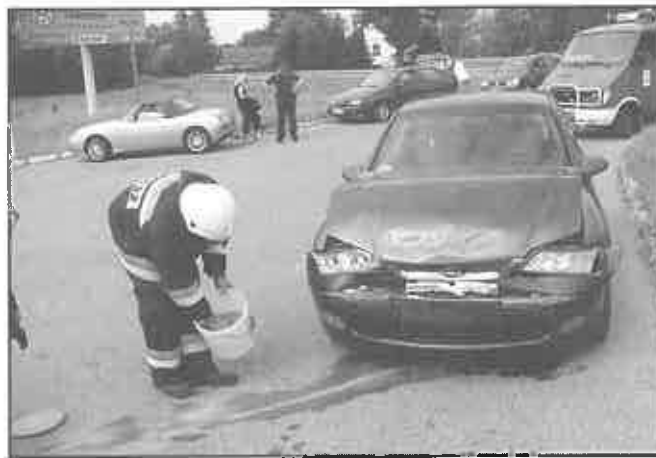
18. sierpnia 2010 r. – Jurków – droga K-75 – kolizja drogowa