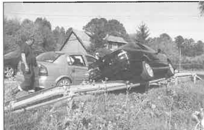
21. sierpnia 2010 r. – Tworkowa – droga K-75 – kolizja