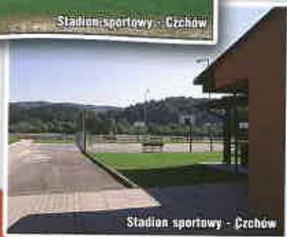
Stadion sportowy - Czchów