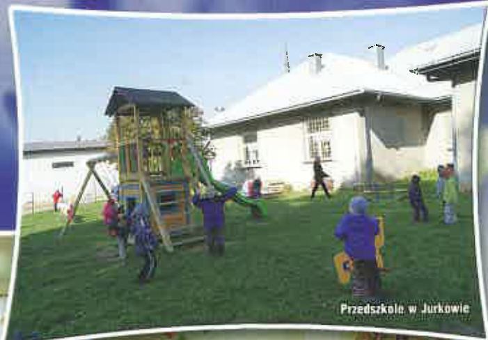
Przedszkole w Jurkowie