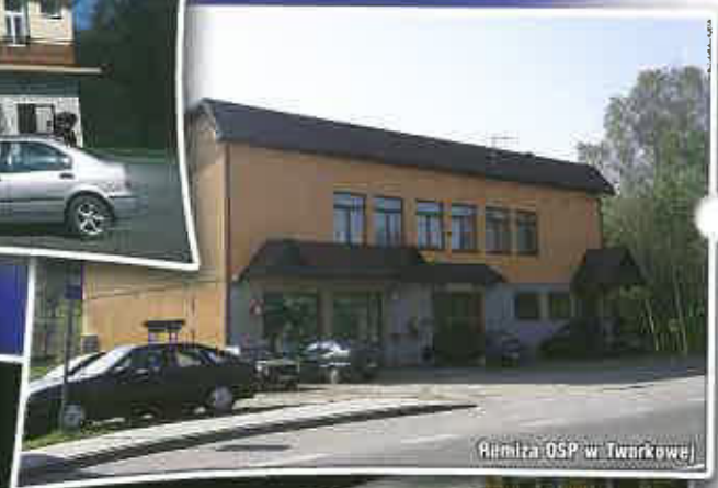
Remiza OSP w Twarkowej