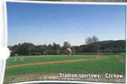
Stadion sportowy - Czchów