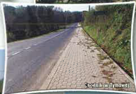
Chodnik w Tymowej