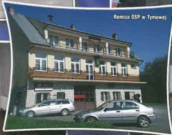
Remiza OSP w Tymowej