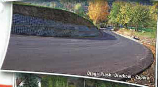
Droga Piaski Drużków - Zapora