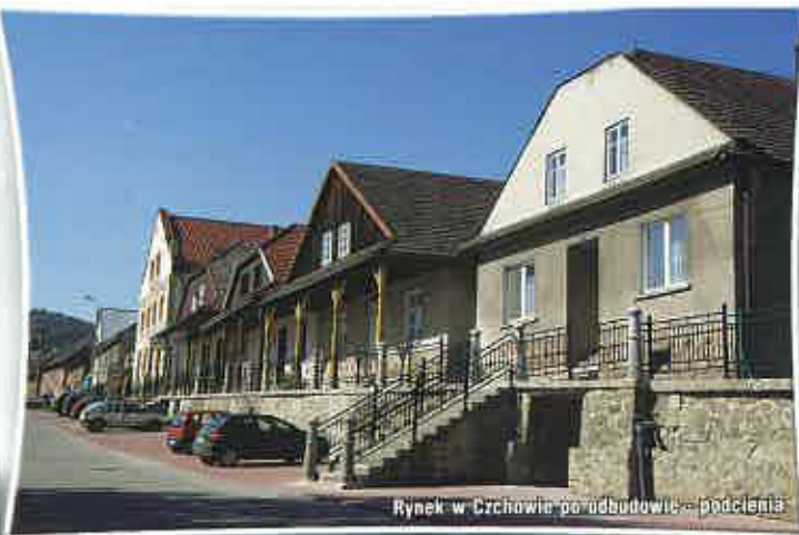
Rynek w Czchowie po odbudowie - podświetlenie