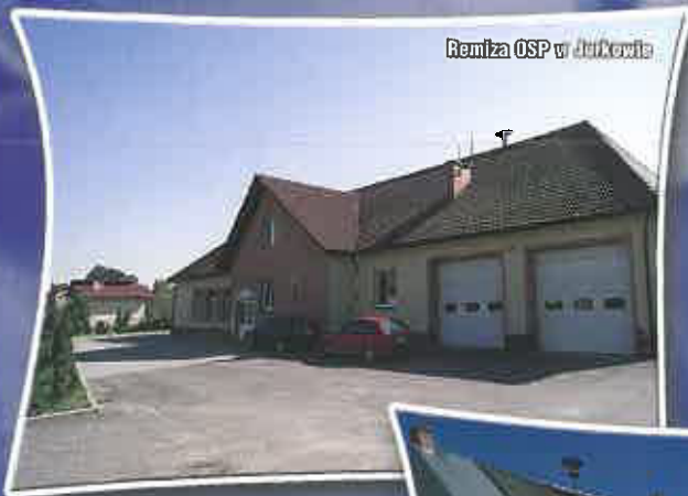
Remiza OSP w Jurkowie