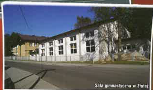
Sala gimnastyczna w Złotej