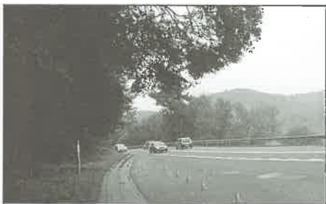
12 września 2010 r. - Wytrzyścza - wezwanie do zagrażających pojazdom drzew