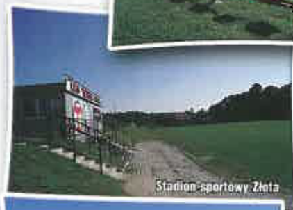
Stadion sportowy - Złota