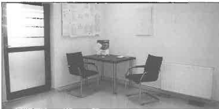
Na miejscu można przygotować wszystkie dokumenty