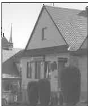
Na remoncie placówki bankowej zyskała estetyka centrum naszego miasta

filii zostało wykonane z myślą o komforcie obsługi klientów. Wydzielono osobne pomieszczenie przeznaczone dla kredytobiorców. Obecnie trwają prace wykończeniowe parkingu z tyłu posesji, na którym znajdzie się 8 miejsc postojowych dla klientów Banku. Filia BSR w rynku jest czynna o poniedziałku do piątku od 8:00 do 15:30 oraz w każdą sobotę od 8:00 do 12:00. Dodatkowym atutem placówki jest całodobowy bankomat. Pracownicy Banku zapraszają do korzystania z bogatej oferty produktów i usług oferowanych przez BSR.