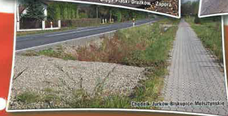
Chodnik Jurków-Biskupice, Melsztynskie