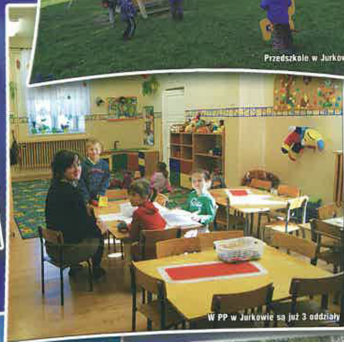
W PP w Jurkowie są już 3 oddziały