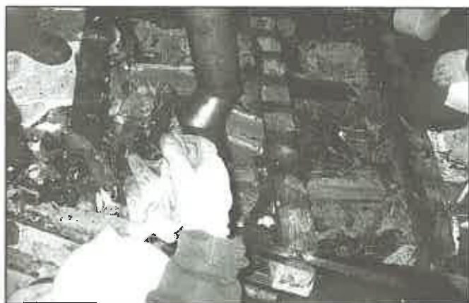
11 września 2010 r. - Czchów Zaporą - pożar domku letniskowego