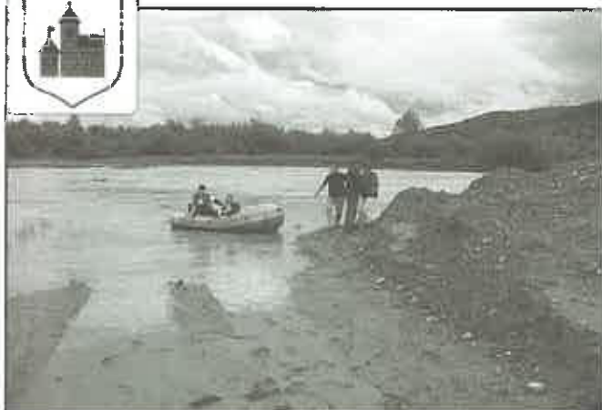
31 sierpnia 2010 r. - Jurków - wyciągnięcie z wody porwanego przez nurt rzeki chłopca