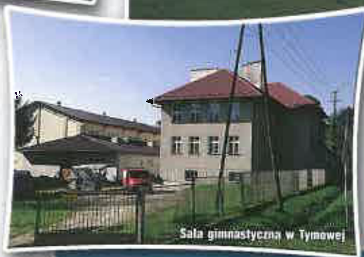
Sala gimnastyczna w Tymowej