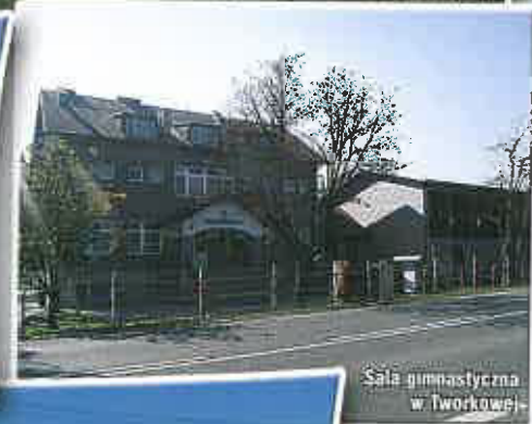
Sala gimnastyczna w Tworkowej