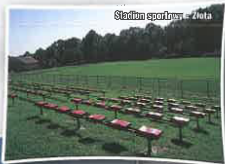
Stadion sportowy - Złota