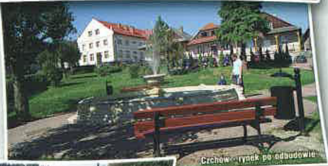
Czchów - rynek po odbudowie