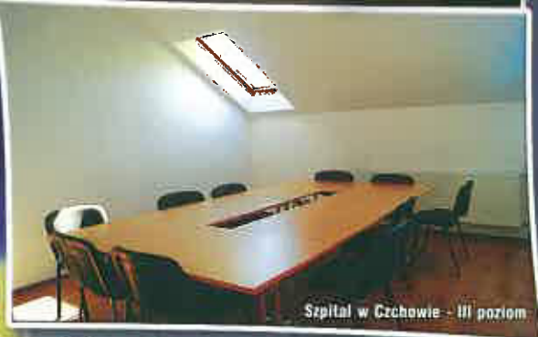
Szpital w Czchowie - III poziom