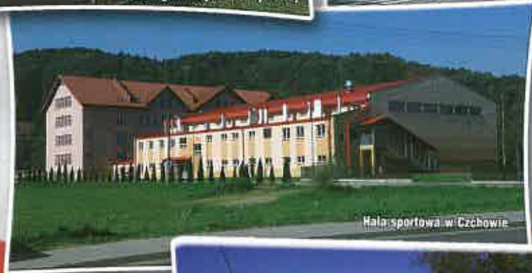
Hala sportowa w Czchowie