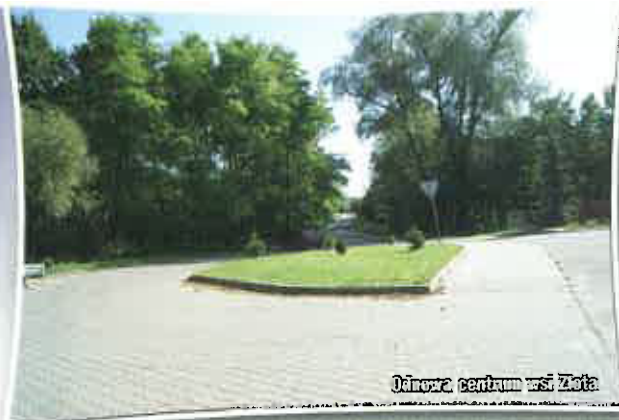
Odnowa centrum wsi Zota