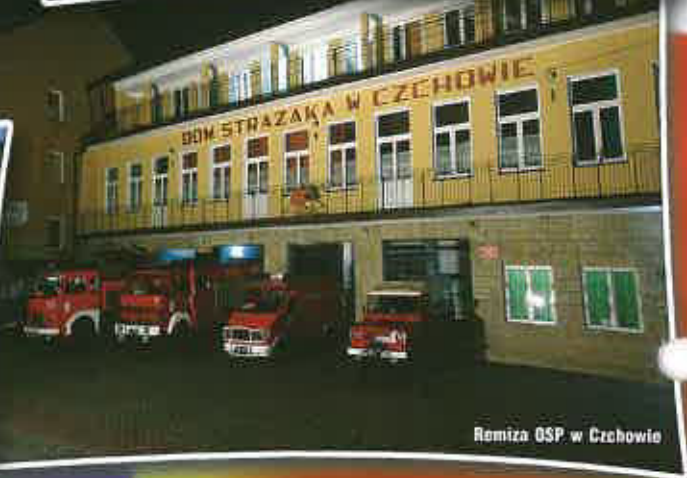
Remiza OSP w Czchowie

wano znaczące, bo ponad 3 mln zł, środki z tzw. Kapitału Ludzkiego (środki unijne). W wyniku tych działań praktycznie wszystkie grupy społeczne skorzystały z projektów w sposób bezpośredni lub pośredni, co przyczyniło się niewątpliwie do rozwoju zainteresowań, rozbudzenia idei przedsiębiorczości oraz rozwoju intelektualnego i materialnego mieszkańców.