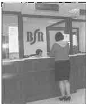
Nowe stanowiska obsługi klientów