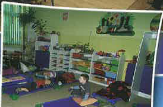
W Czchowskim przedszkolu