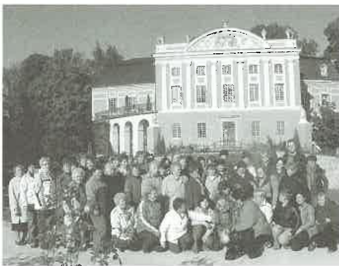
Wycieczka dla Kół Gospodyń Wiejskich