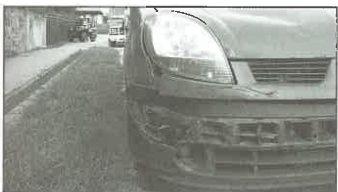
15 marca br. - Czchów - droga K-75 - kolizja drogowa