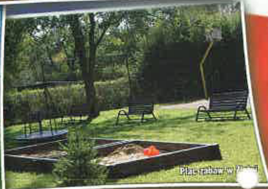
Plac zabaw w Jurkowie

konieczność dostosowania warunków dla właściwego procesu wychowania młodzieży, promocji zdrowia i tężyzny fizycznej.