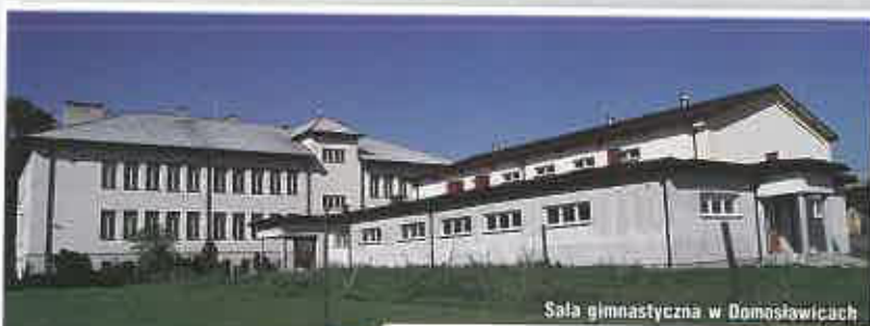
Sala gimnastyczna w Domosławicach