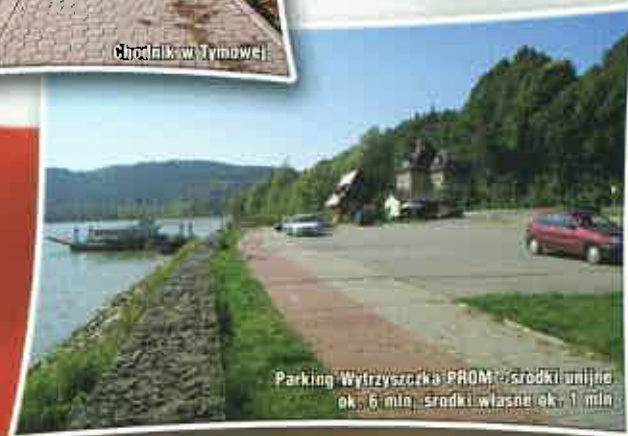
Parking Wytrzyższka - PROM - środki unijne ok. 6 mln, środki własne ok. 1 mln

Okres ten jest także sprzyjający dla rozwoju oświaty, kultury, sportu, służby zdrowia i opieki społecznej. W wyniku działań władz samorządowych, dyrektorów szkół, nauczycieli oraz dzięki wysiłkowi uczniów, osiągamy w regionie najwyższe wyniki w egzaminach końcowych w szkołach podstawowych i gimnazjalnych..