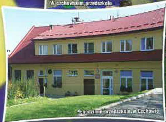
9-godzinne przedszkole w Czchowie