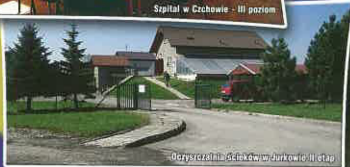
Oczyszczalnia ścieków w Jurkowie II etap